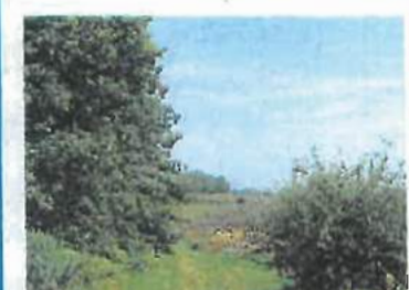
Trace de la voie romaine