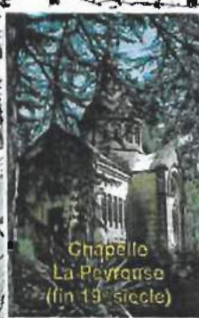
Chapelle La Peyrouse (fin 19 e siècle)