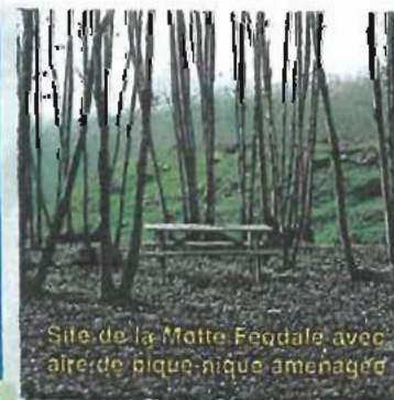
Site de la Motte Féodale avec aire de pique-nique aménagée