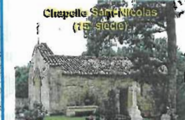
Chapelle Saint-Nicolas (15 e siècle)