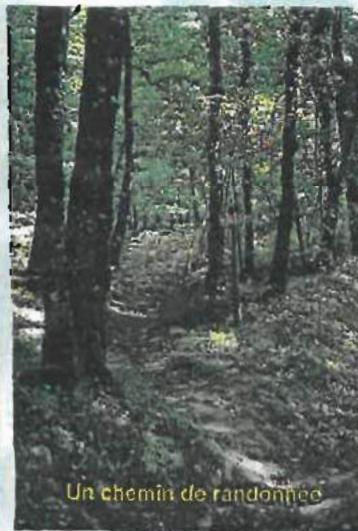
Un chemin de randonnée