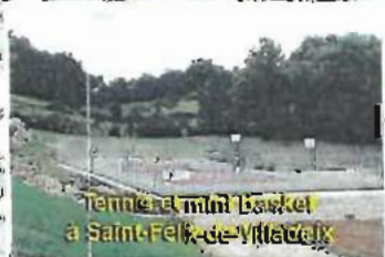
Tennis et mini basket à Saint-Felix-de-Villadeix