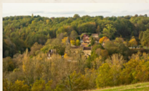
Le Bourg depuis Caveroussié