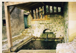
Lavoir du Bourg

Départ Entrer dans le bourg. Sur le côté de l'église, avancer sur la place du Cayla : point de vue sur la Vallée de la Louyre . Revenir à l'église, prendre à gauche et descendre vers la Vallée de la Louyre en passant devant le lavoir.