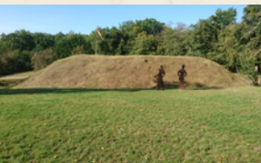
La Motte Castrale

Balissage : Panneaux bois - GR de Pays : jaune et rouge