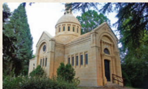
Chapelle de La Peyrouse