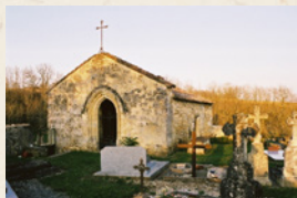
Chapelle Saint Nicolas