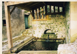
Lavoir du Bourg

Départ De la mairie, entrer dans le bourg. Devant l'église, Place du Cayla, point de vue sur la Vallée de la Louyre. Avant l'église prendre à droite et descendre dans la vallée de la Louyre.